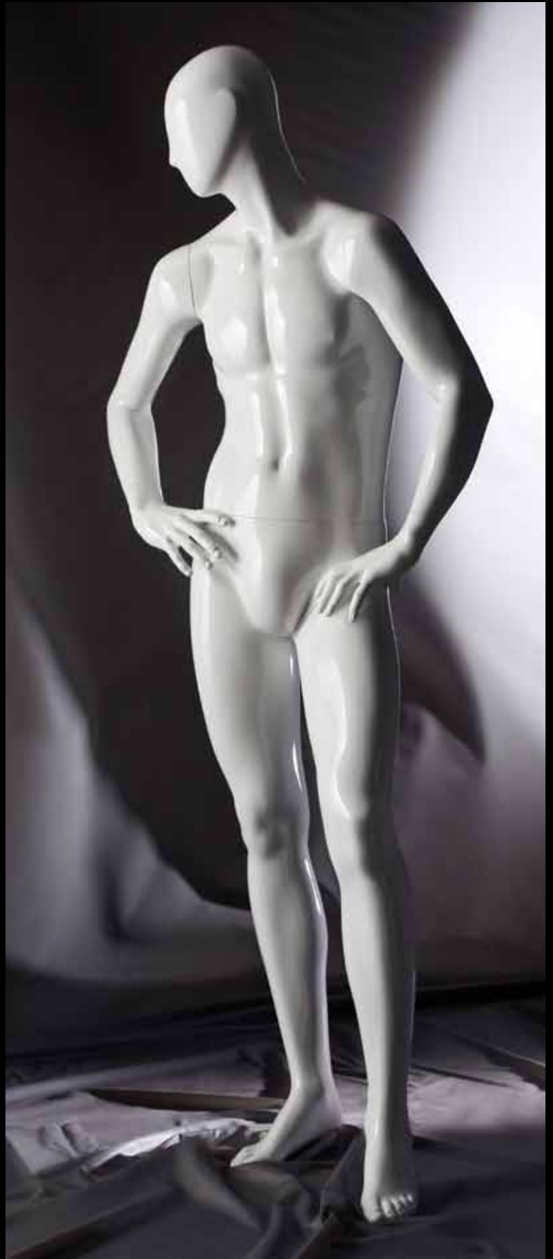
Body Col.: 287 Glossy White