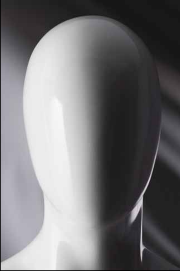
Head: S 228