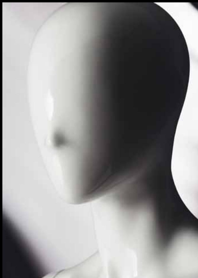
Head: J 248