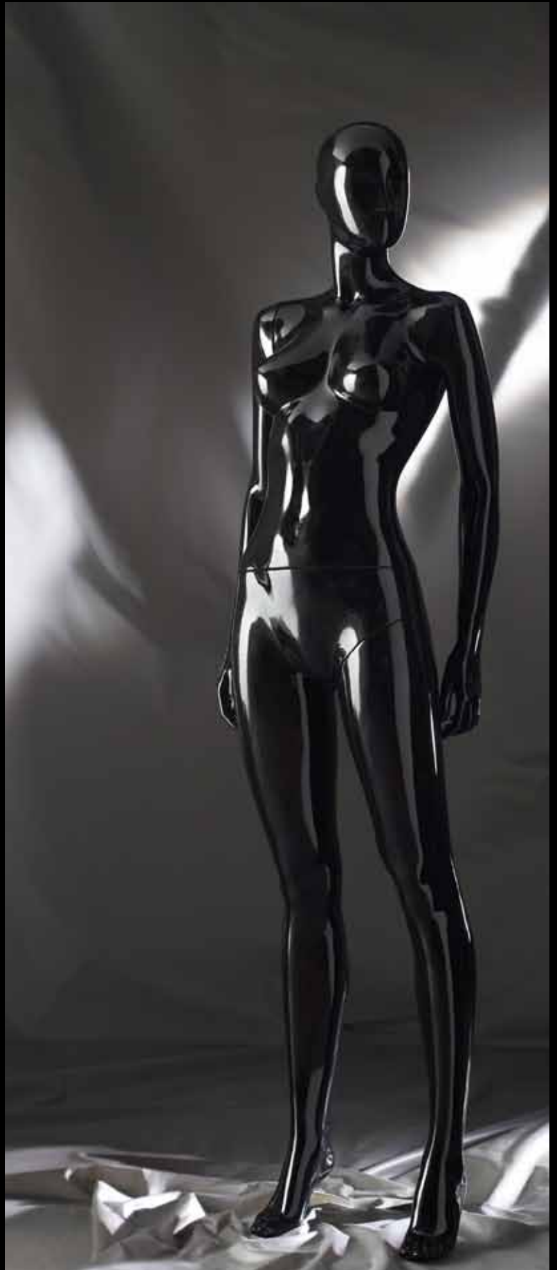
Body Col.: Glossy Black