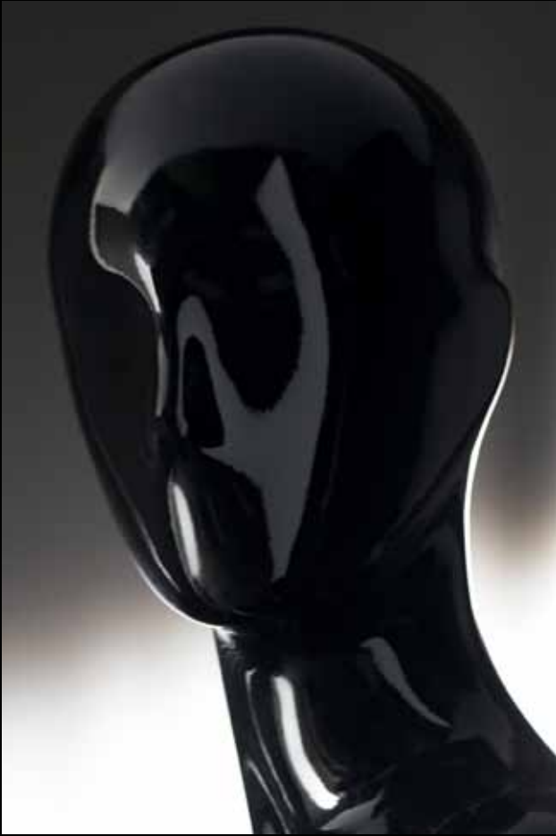
Head: J 266