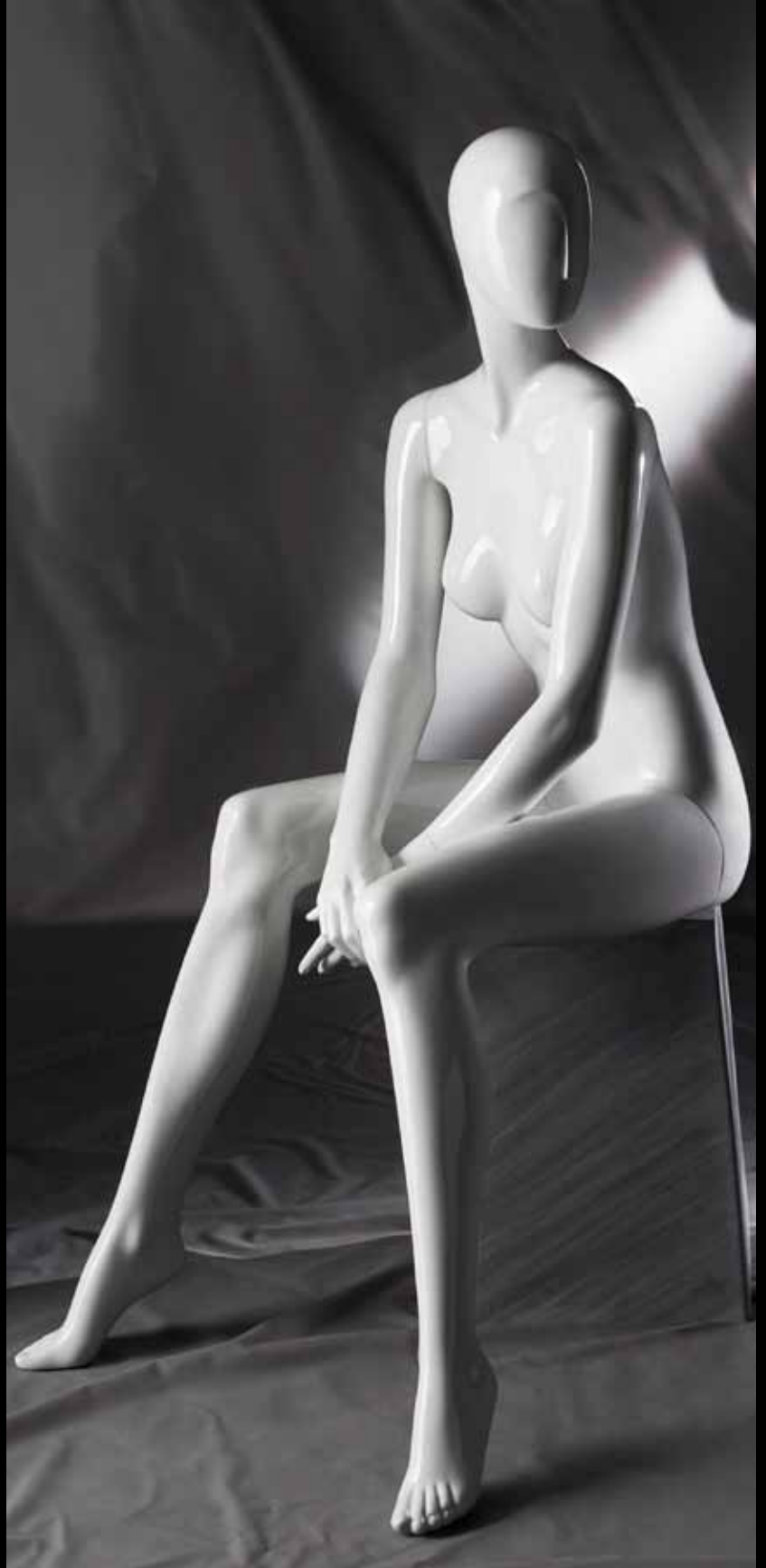
Body Col.: 287 Glossy White