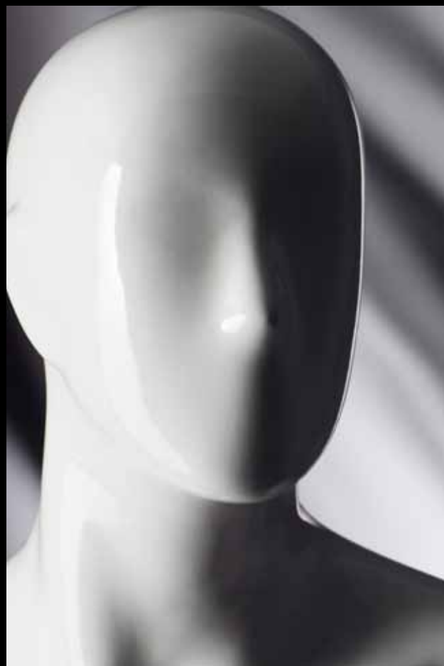
Head: S 17