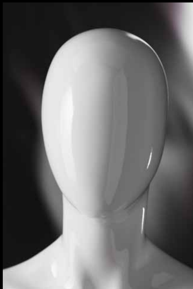
Head: J 250