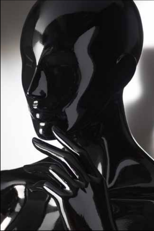
Head: J 269