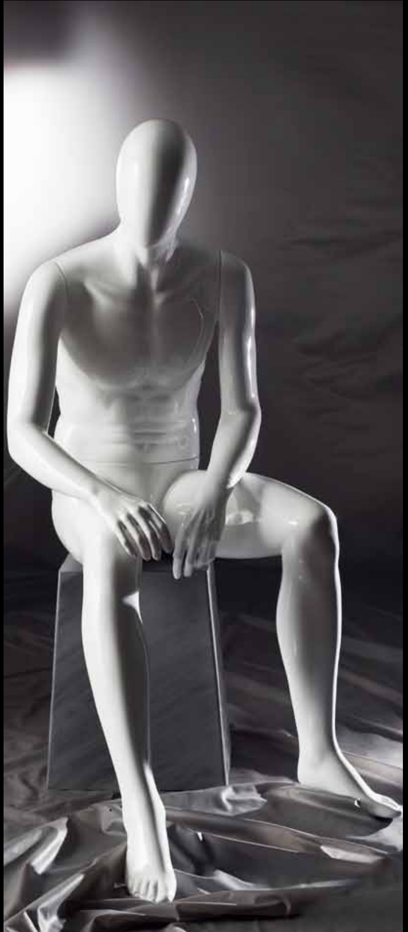
Body Col.: 287 Glossy White