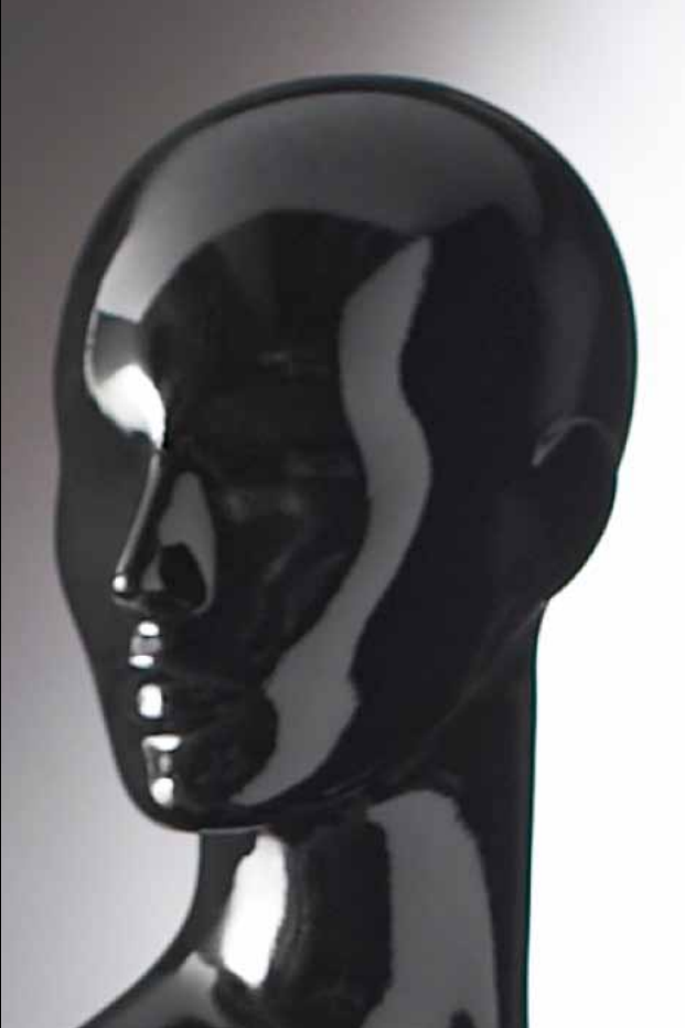
Head: J 269