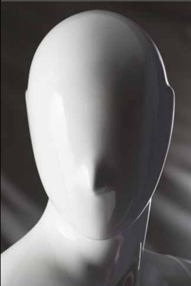
Head: S 226