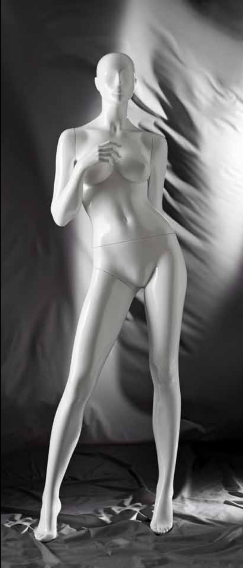
Body Col.: 287 Glossy White