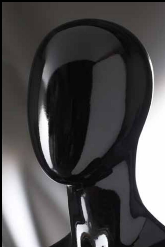
Head: J 250