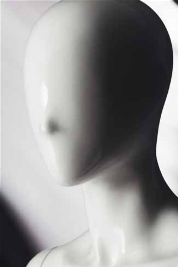
Head: J 248