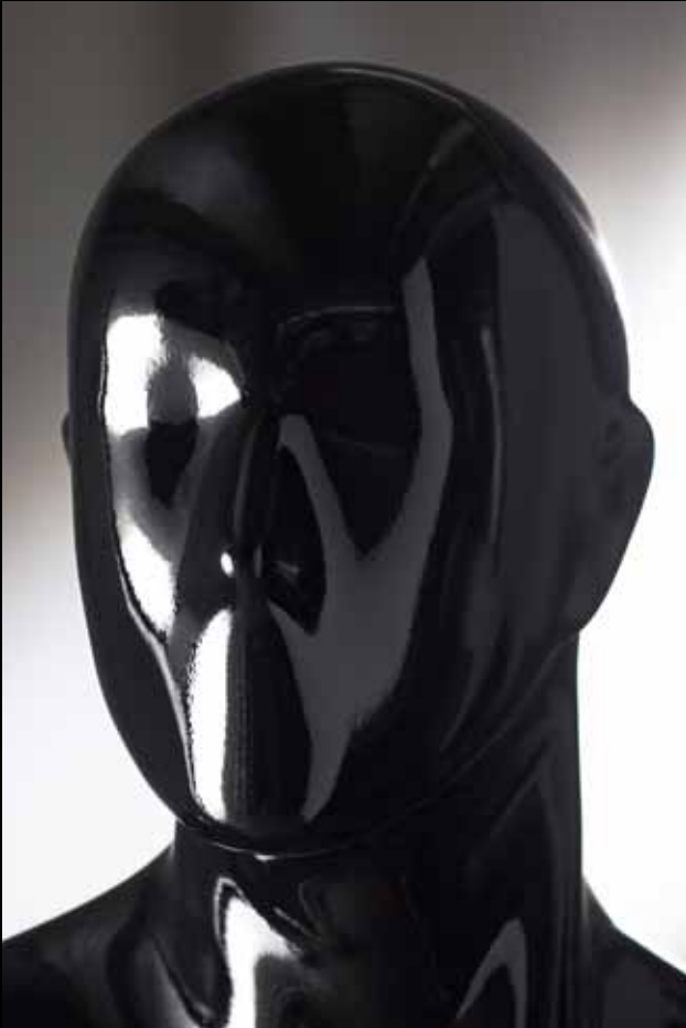
Head: S 17