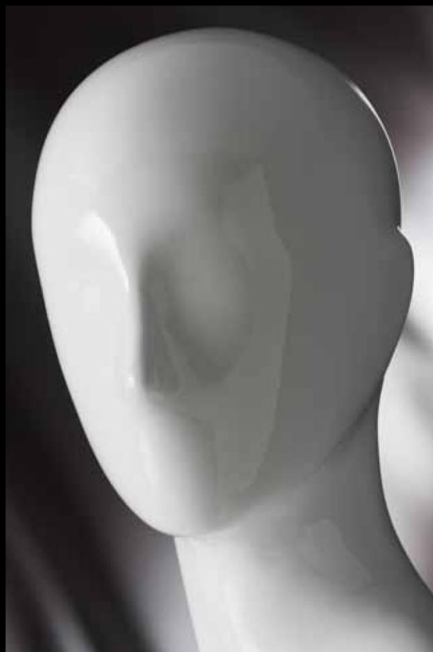
Head: J 266