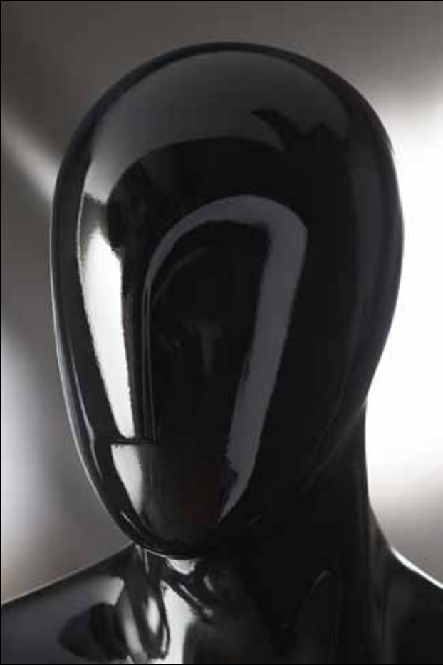
Head: S 241