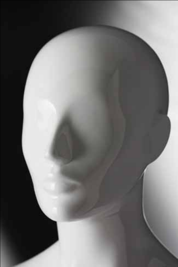
Head: J 269