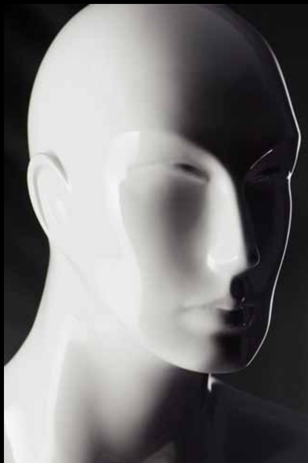
Head: S 247