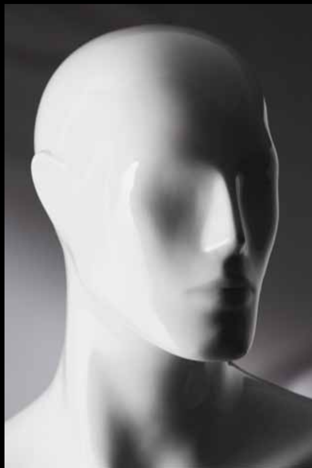
Head: S 234