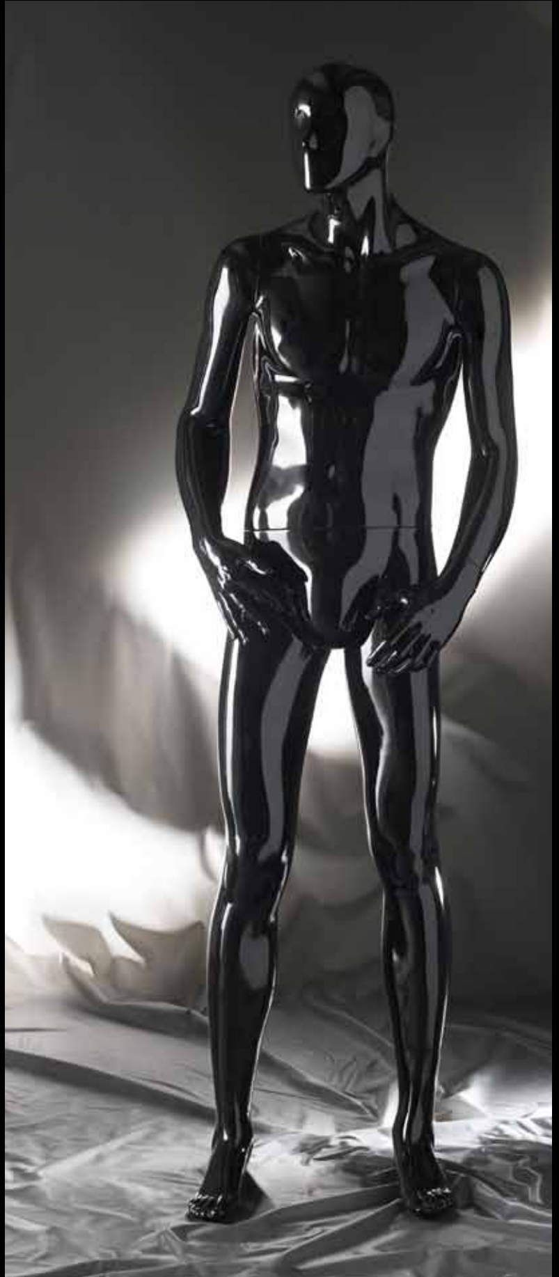
Body Col.: Glossy Black