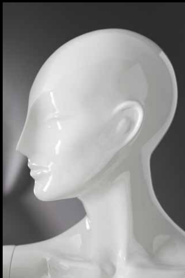
Head: J 271