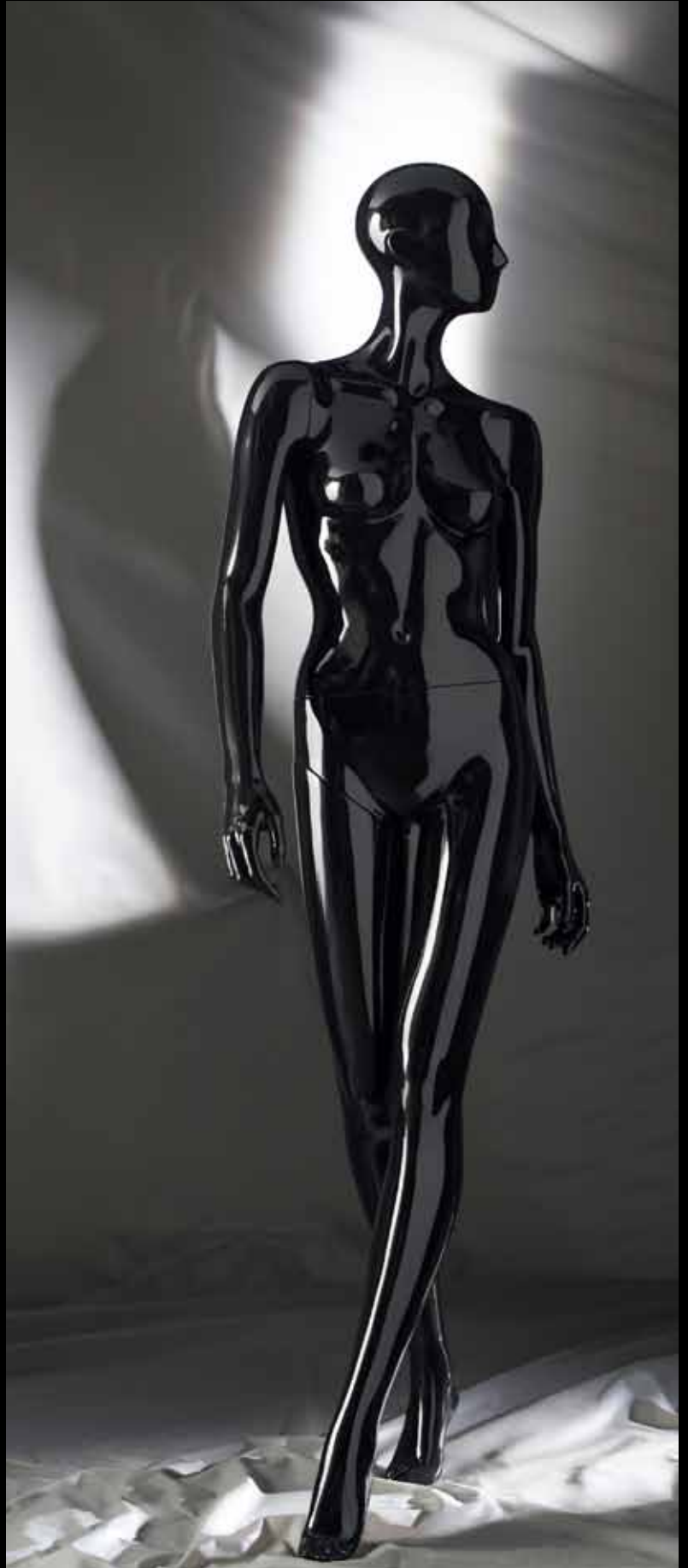
Body Col.: Glossy Black