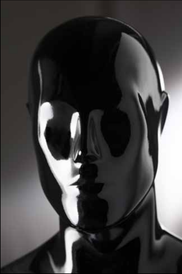
Head: S 234