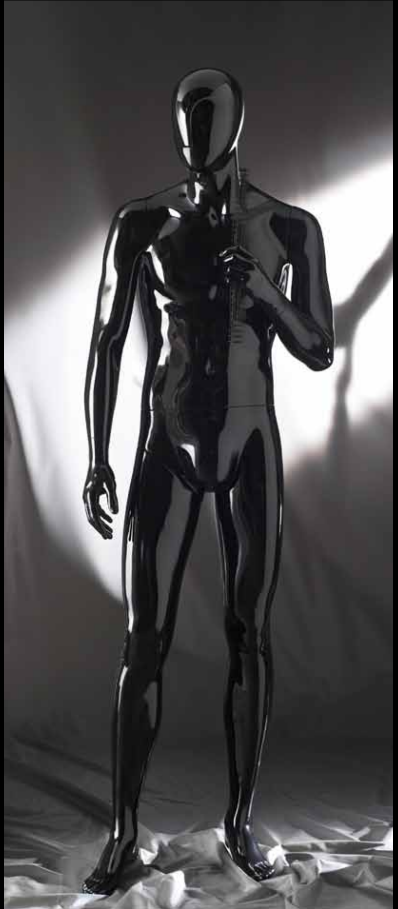
Body Col.: Glossy Black