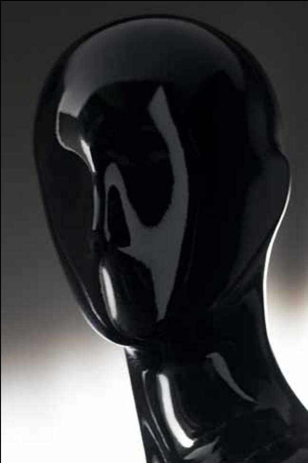
Head: J 266