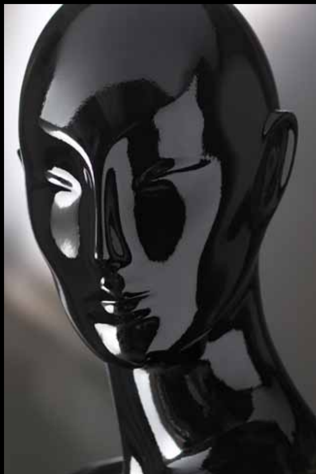
Head: J 271