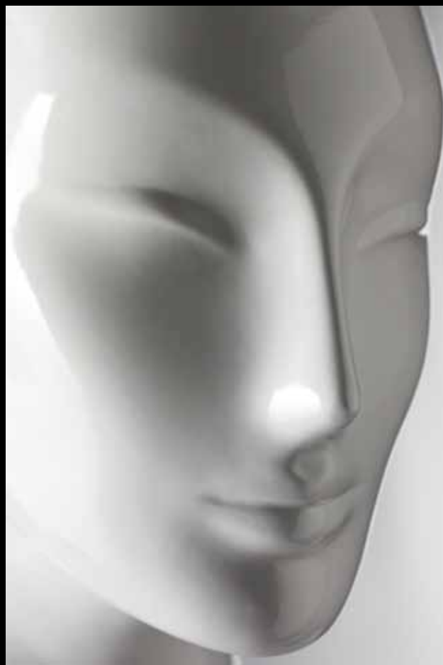
Head: J 271