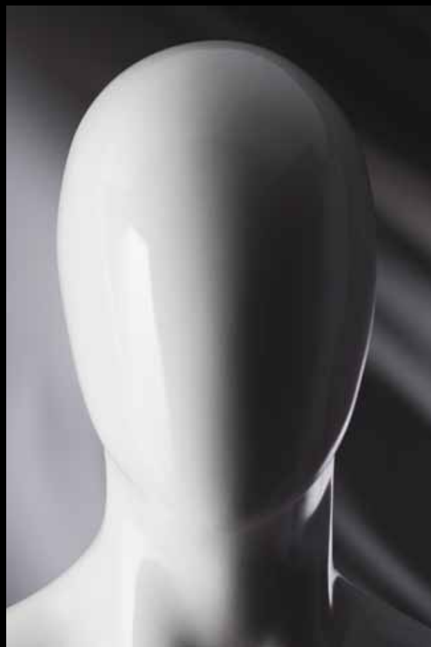
Head: S 228