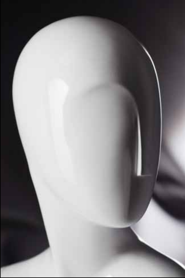
Head: J 268