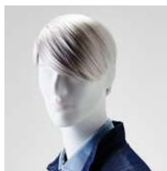
Head S266 AL Wig NWM 417 Make-up U 193