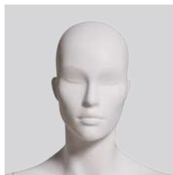
Head J300 AL