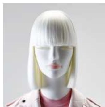
Head J300 AL Wig NWL 881 Make-up AL 589