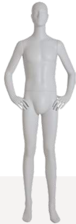
Mod. 5406 Head S277