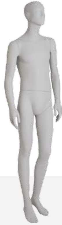
Mod. 5403 Head S277