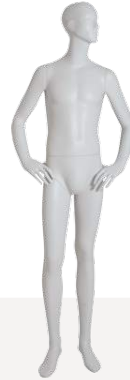
Mod. 5410 Head S277