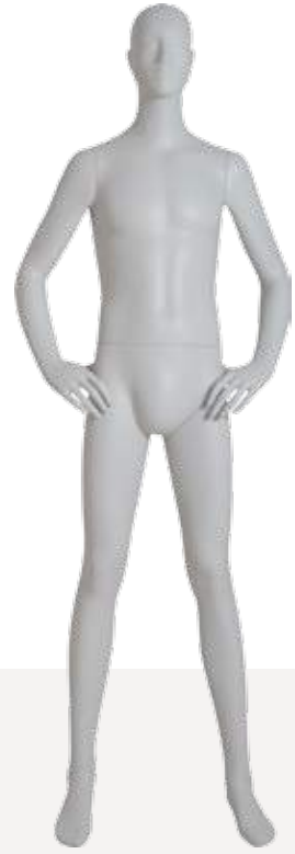
Mod. 5400 Head S277