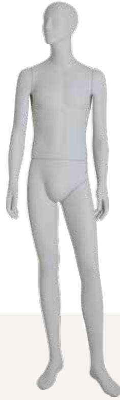
Mod. 5401 Head S277