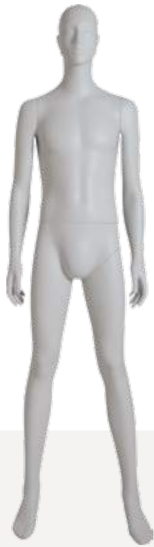
Mod. 5404 Head S277