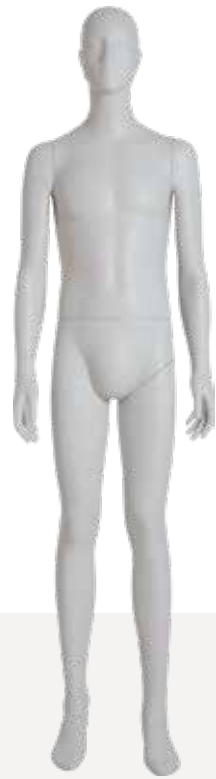
Mod. 5405 Head S277