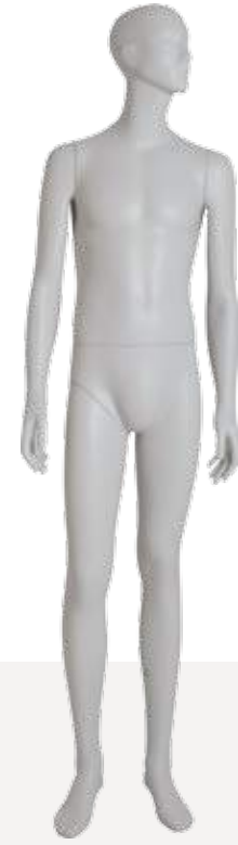
Mod. 5407 Head S277