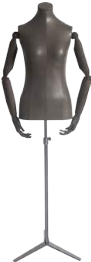
Articolo Article 3445NAT03