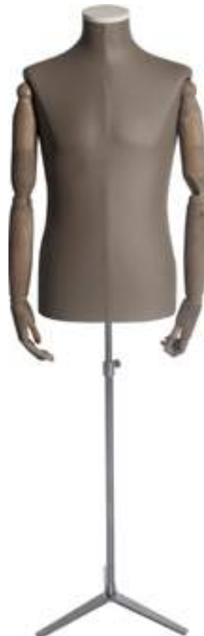
Articolo Article 1004NAT03