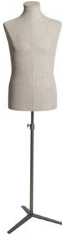
Articolo Article 1004NAT02