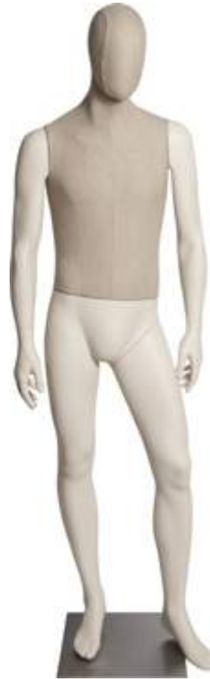
Modello Model 2900NAT01