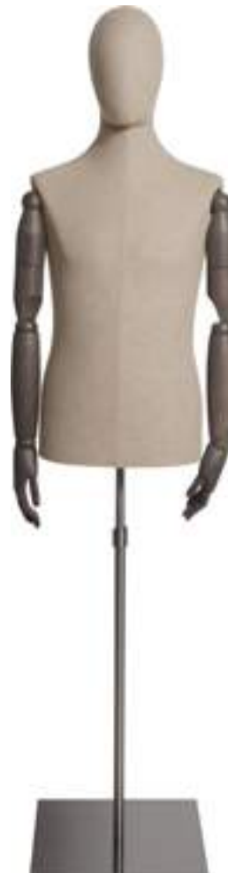
Articolo Article 1004NAT01