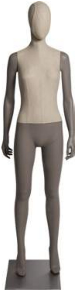
Modello Model 4400NAT01