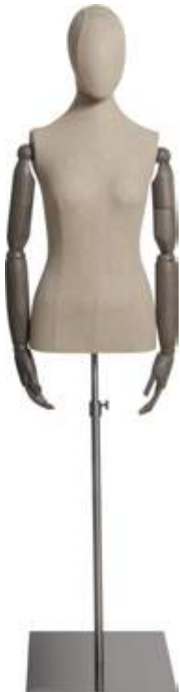
Articolo Article 3445NAT01