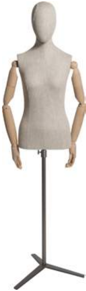
Articolo Article 3445NAT02