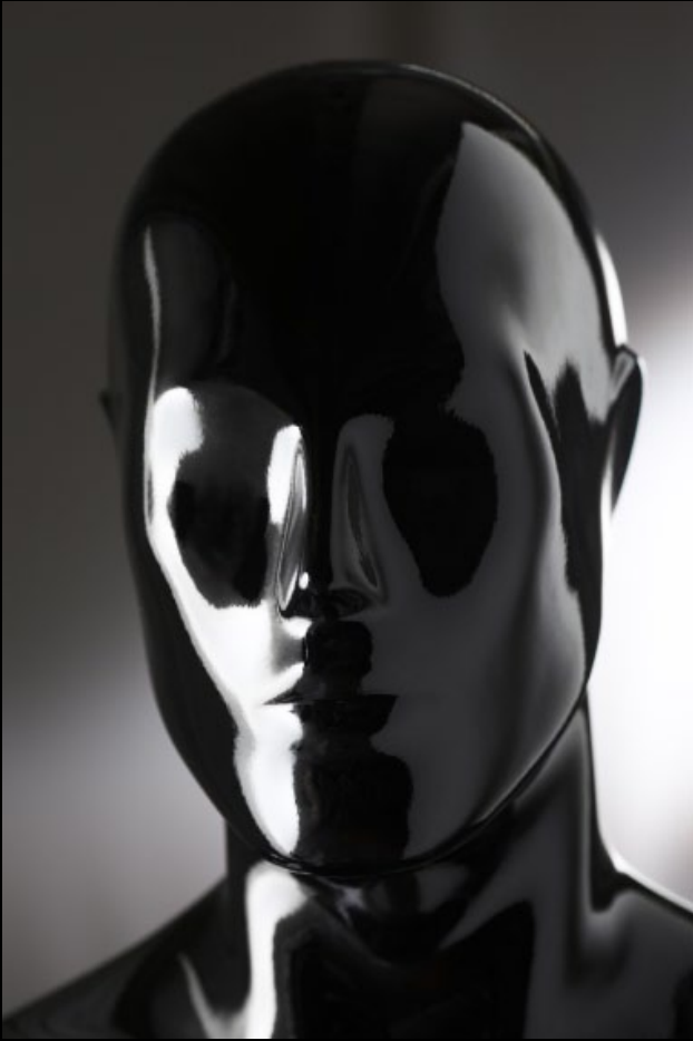
Head: S 234