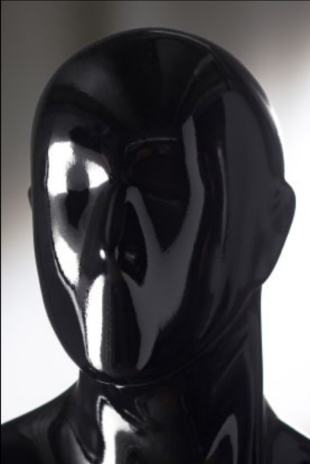
Head: S 17