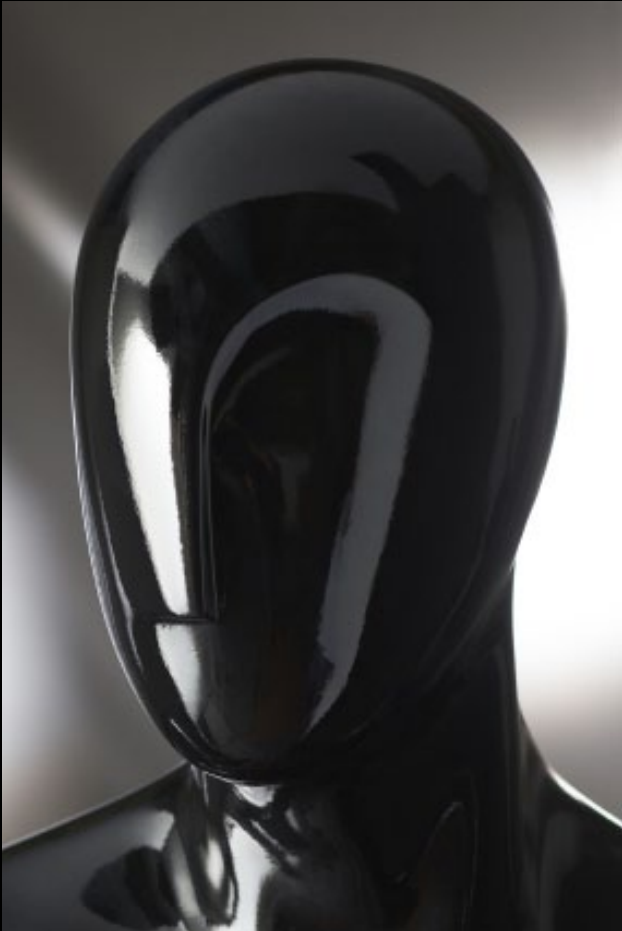
Head: S 241