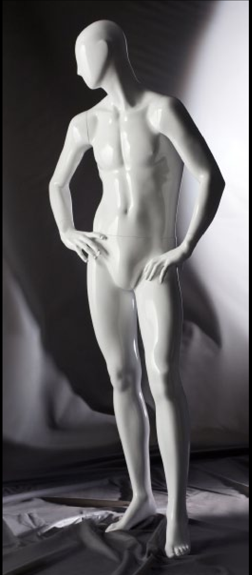
Body Col.: 287 Glossy White