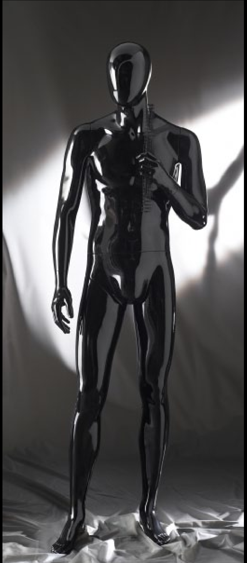
Body Col.: Glossy Black