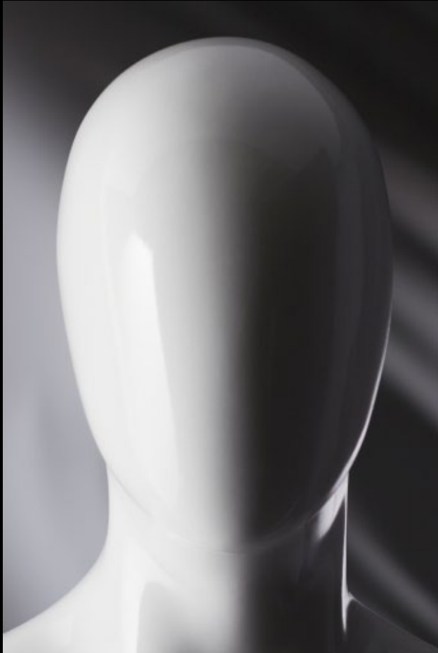
Head: S 228