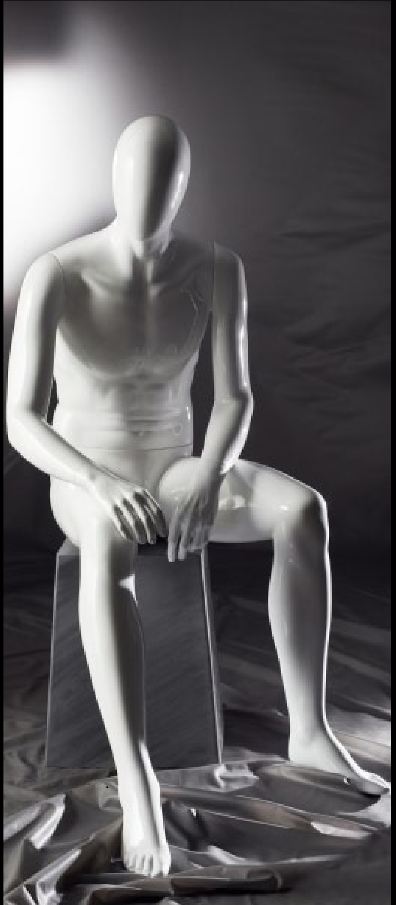
Body Col.: 287 Glossy White