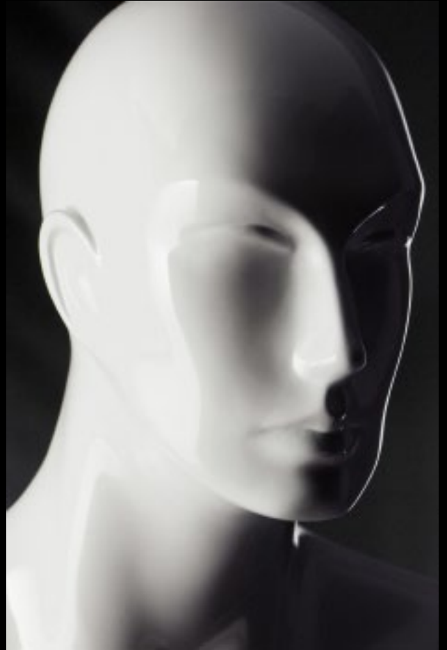
Head: S 247