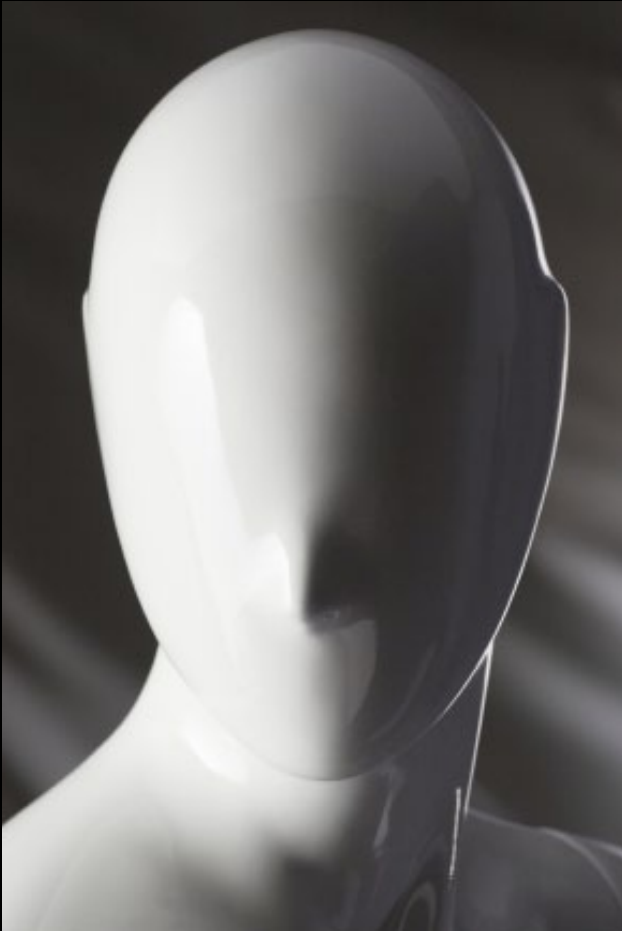
Head: S 226